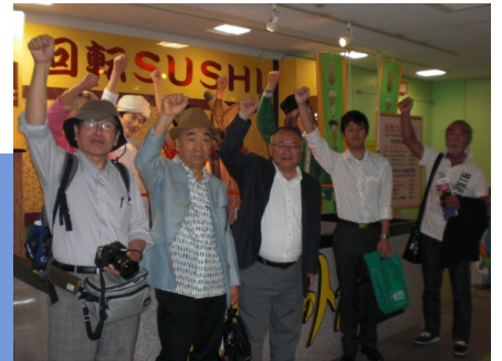
台場1丁目商店街 昭和30年代をイメージしたレトロな町並みを再現した商店街で、