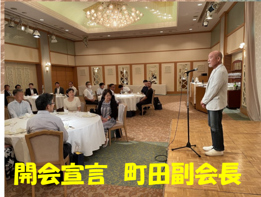
開会宣言 町田副会長