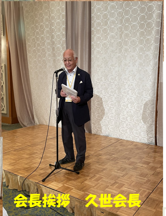
会長挨拶 久世会長