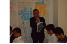
顧問総評 天水顧問