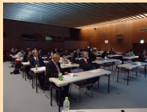
顧問総評 天水顧問